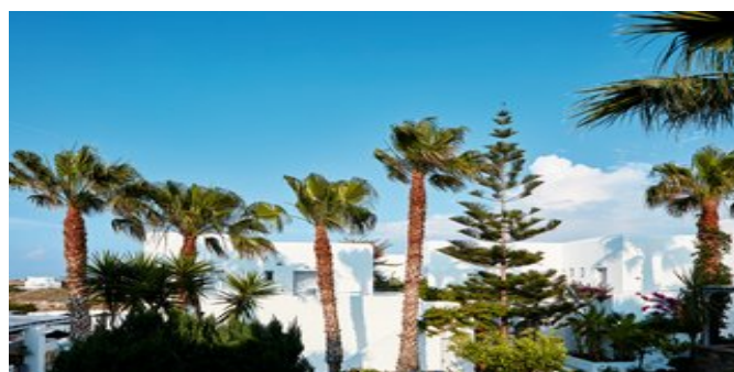
Das Mr & Mrs White Paros Hotel