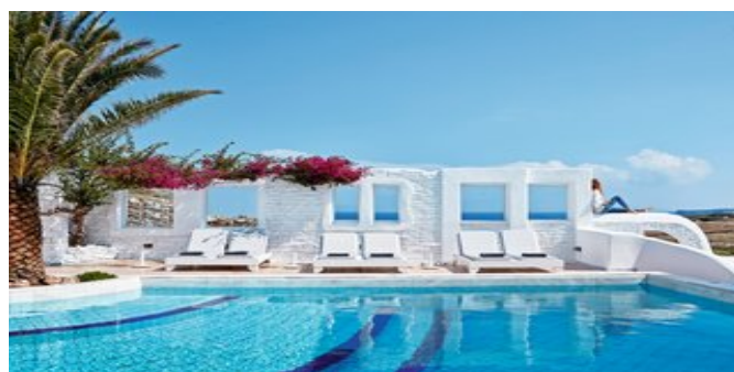
Einer der Pools