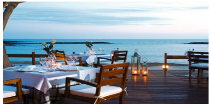
Das À-la-carte-Restaurant "Kymata"