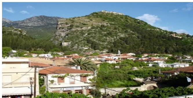
Blick vom Hotel

EXTRAS Das Hotel ist Teil unserer Rundreise "Drive & Hike Peloponnes".