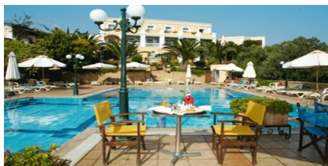
Das Hotel Crithoni's Paradise mit Pool