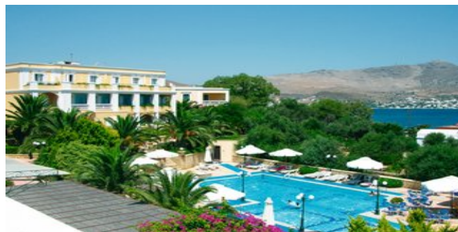
Das Hotel Crithoni's Paradise

ATTIKA SERVICE Deutschsprachige Reiseleitung. Fähr-/Landtransfer bei Pauschalreise inklusive.