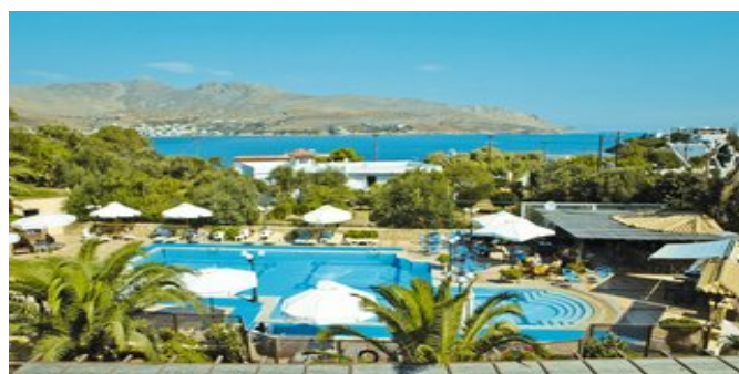
Blick über den Pool