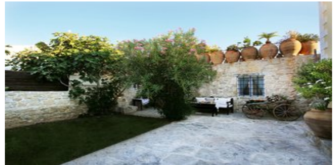
Der Garten der Villa Kamilari