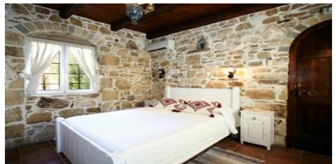
Der Schlafraum der Villa Kamilari