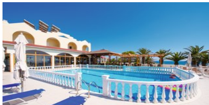
Die Anlage mit Pool

APPARTEMENTS (AA) Ca. 25 qm. Für 2-3 Erwachsene (bitte beachten: die 3. Person darf max. 18 Jahre alt sein) oder 2 Erwachsene und 2 Kinder. Lage in einem der Nebengebäude.