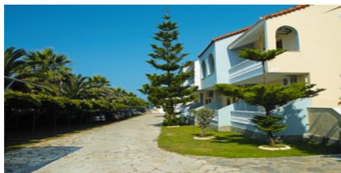
Die Hotel-Appartements Katerina