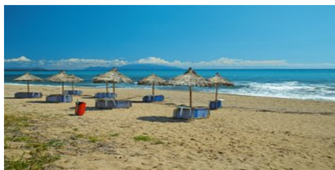
Der Strand bei der Anlage