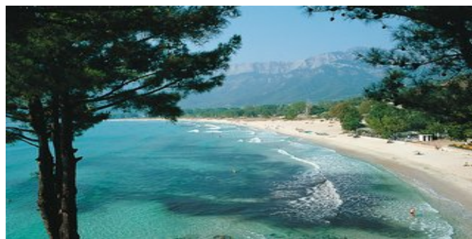
Der Strand von Chrissi Ammoudiá