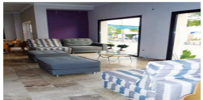
In der Lobby