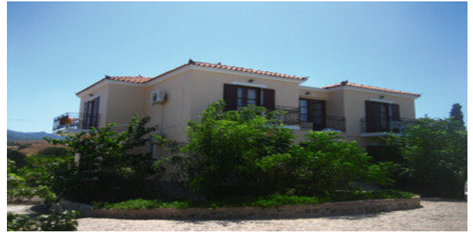
Das Marianthi Paradise Hotel