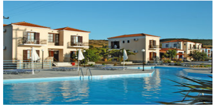
Das Marianthi Paradise Hotel

STRAND Einen schmalen, flach abfallenden, Steinstrand erreichen Sie in ca. 1 km Entfernung. Wir empfehlen Badeschuhe. Strandduschen. Liegen und Sonnenschirme (gegen Gebühr). Etwa 100 m weiter befindet sich ein breiter, langer Sandstrand mit einigen Liegen und Sonnenschirmen (gegen Gebühr).