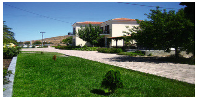
Ein Teil des Hotels