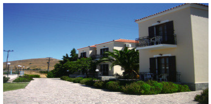
Das Marianthi Paradise Hotel