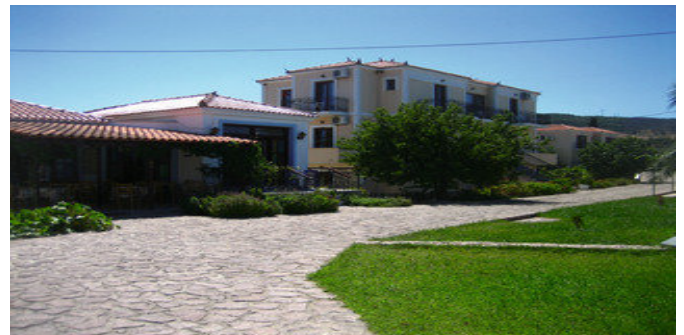
Das Marianthi Paradise Hotel