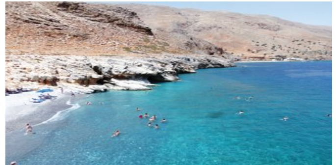
Eine der Badebuchten in der Nähe von Loutró