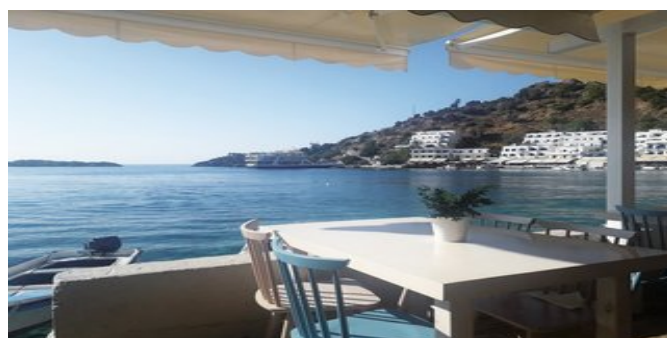
Auf der Terrasse