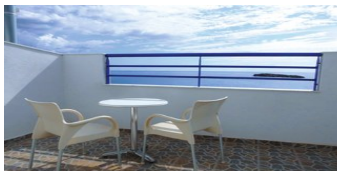
Blick vom Balkon