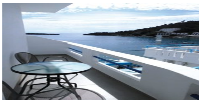
Blick vom Balkon