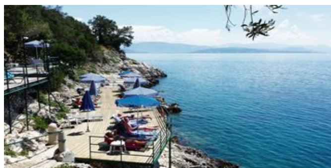
Eines der Badeplattformen