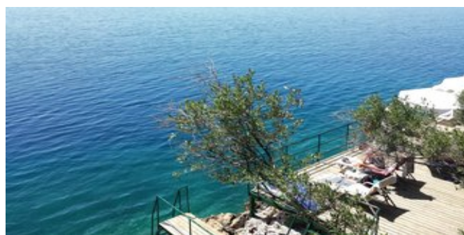
Eine der Badeplattformen