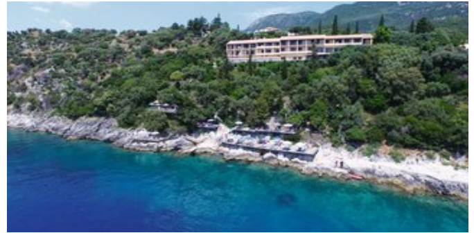
Das Nautilus Barbati Hotel

VERPFLEGUNG HP, AI (kontinentales Frühstücksbuffet von 8.00-10.00 Uhr und Abendessen in Buffetform von 18.00-20.00 Uhr).