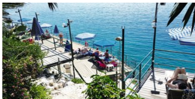
Eine der Badeplattformen