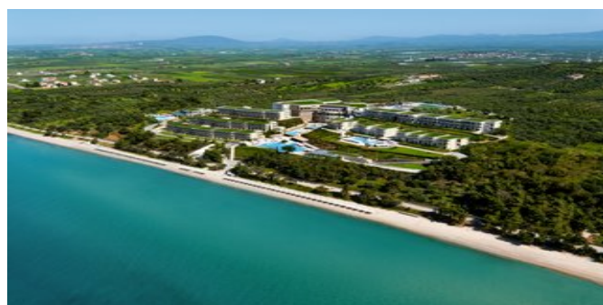
Die Anlage Ikos Oceania