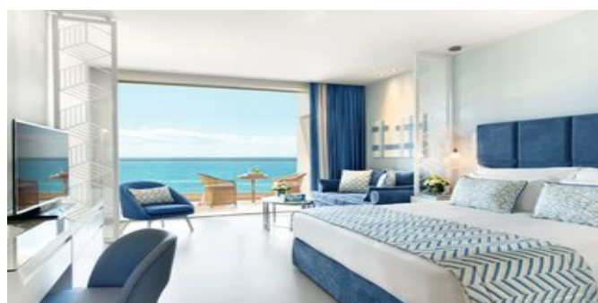
Wohnbeispiel Juniorsuiten mit Meerblick