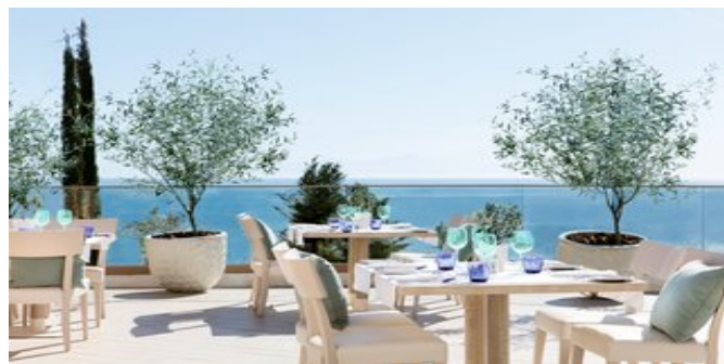
Im Fresco Restaurant

JUNIORSUITEN (UA/UI) Ca. 35 qm. Für 2-3 Personen. Grundausrüstung wie die Superiorzimmer. Zusätzlich Wohncke mit Schlafcouch für die 3. Person. Bad oder Dusche/WC, Föhn, Bademantel, Badeartikel.