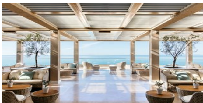
Auf der Veranda