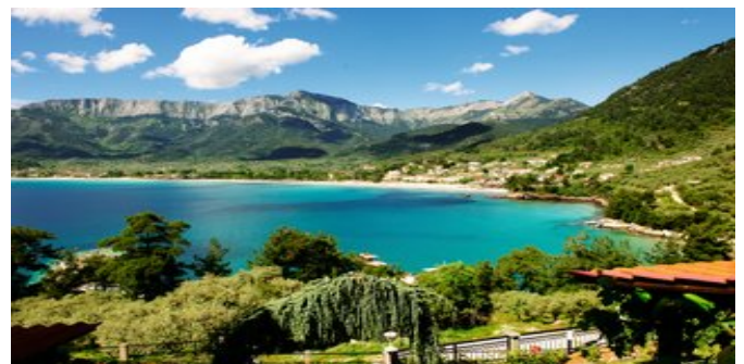
Blick von der Anlage