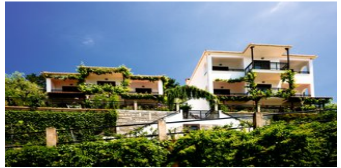
Das Hotel Villa Island View