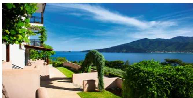
Die Villa Island View