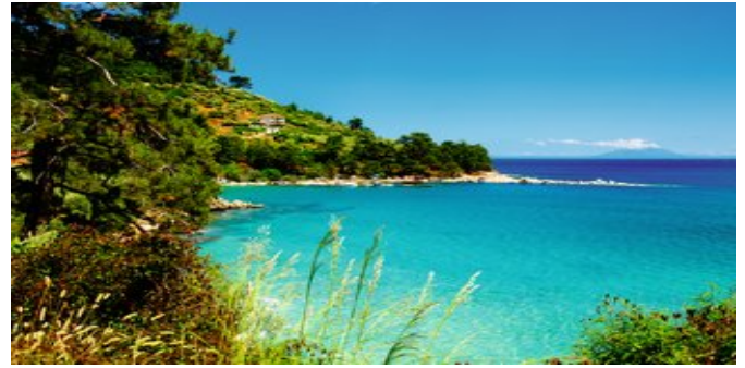
Die Bucht unterhalb des Hotels