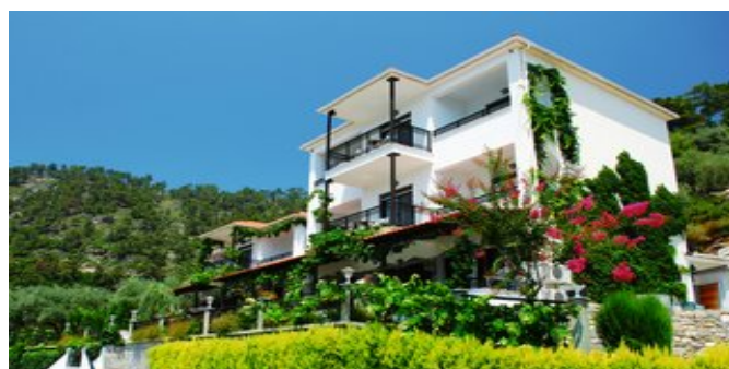
Das Hotel Villa Island View