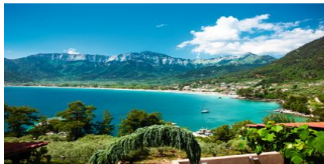
Blick auf die Bucht unterhalb des Hotels