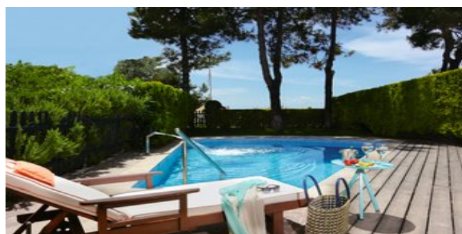
Wohnbeispiel Suiten mit privatem Pool