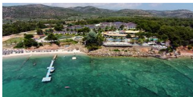
Blick auf die Anlage und den Strandbereich