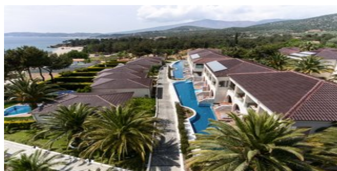
Blick auf einen Teil der Anlage