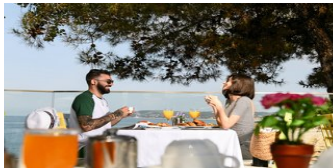
In der Open-Air-Taverne