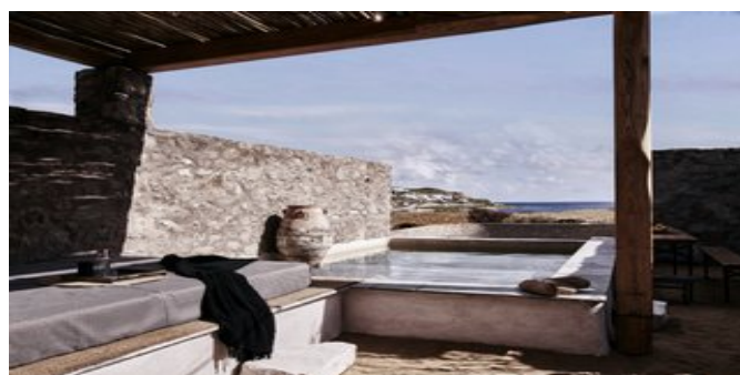
Wohnbeispiel Kukulu Suiten