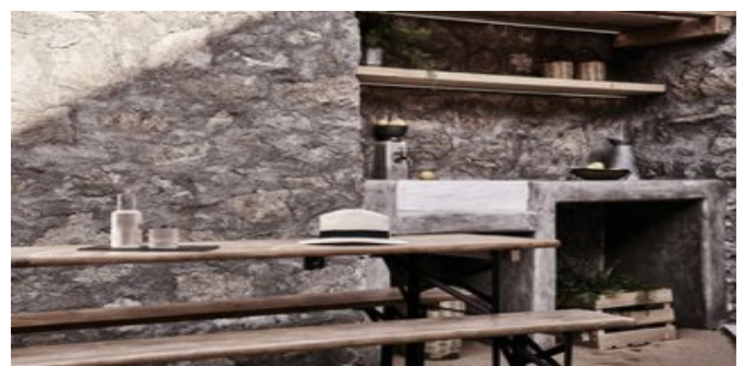
Wohnbeispiel Nomad Suites