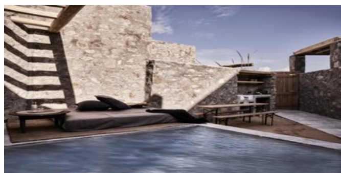
Wohnbeispiel Nomad Suiten