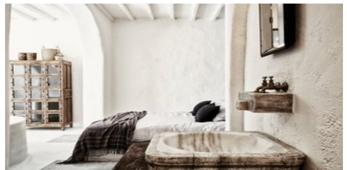
Wohnbeispiel Nomad Suites