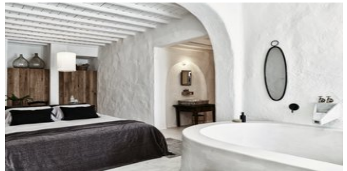
Wohnbeispiel Grand Suites 2 Schlafzimmer