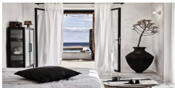
Wohnbeispiel Honeymoon Suiten