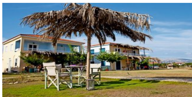
Die Chloe Apartments