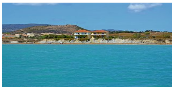
Blick auf die Apartments