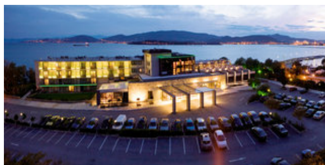
Das Xenia Volos Domotel