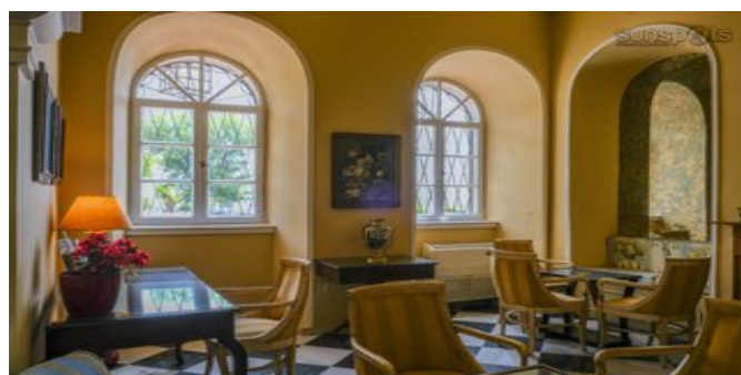
Der Aufenthaltsbereich mit Looby-Bar