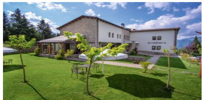
Das Anavasi Mountain Resort