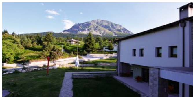
Das Anavasia Mountain Resort