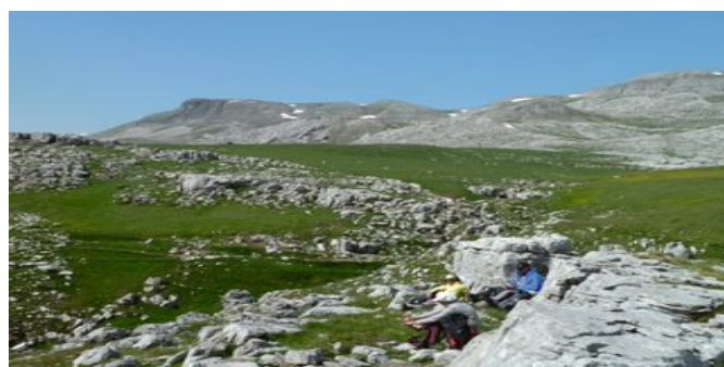
Hochebene zwischen Gamila und Astraka