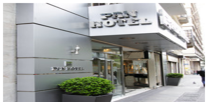
Das Hotel Pan