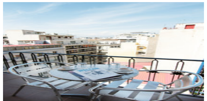
Auf dem Balkon