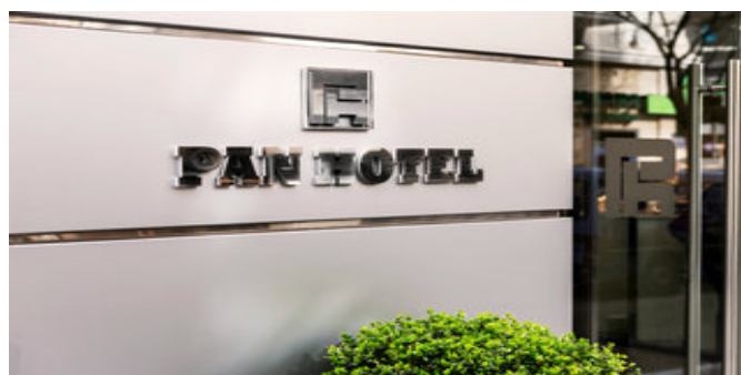
Das Pan Hotel