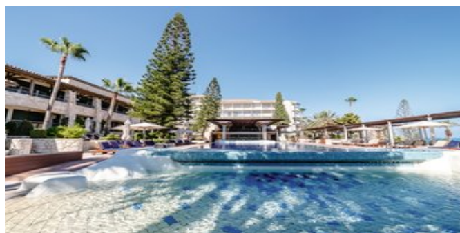
Einer der Pools