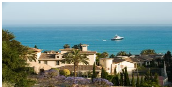
Blick über die Anlage auf das Meer