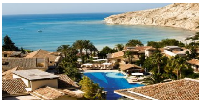
Blick ¼ber die Anlage