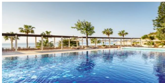
Einer der Pools

EXECUTIVE SUITEN (UD/UE/UF) Ca. 47 qm. Für 2-3 Erwachsene oder 2 Erwachsene und 2 Kinder. Grundausstattung wie die Juniorsuiten, jedoch geräumiger. Marmorbad/WC, separate Dusche, Föhn. Balkon oder Terrasse mit Gartenblick (= UD), mit Pool- oder seitlichem Meerblick (= UE) oder mit Meerblick (= UF).