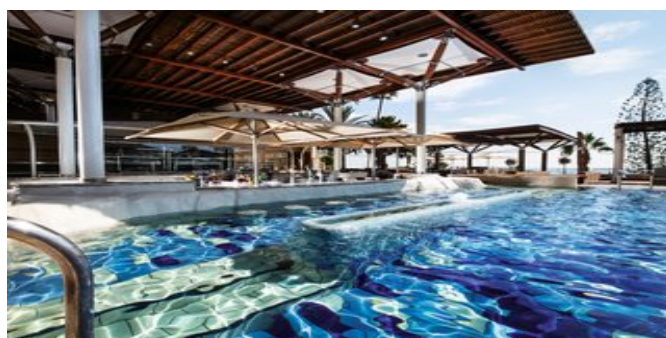
An der "Cape Aspro" Poolbar