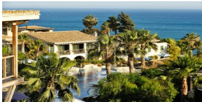
Blick von der Anlage auf das Meer

POOLBEREICH In dem herrlichen Landschaftsgarten liegt der in Form einer Lagune angelegte, 80 m lange Süßwasserpool, der quer durch die Anlage verläuft und mit dem Hallenbad (saisonbedingt beheizt) verbunden ist. Das Hallenbad ist für Kinder nur von 9 bis 14 Uhr zugänglich. Ein weiterer Pool mit Terrasse befindet sich im östlichen Teil der Anlage, direkt oberhalb des Strandes. Beide Außenpools jeweils mit Kinderbecken, Liegen und Sonnenschirmen.