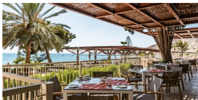
Im Restaurant "Cape Aspro"