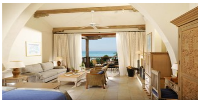
Wohnbeispiel Executive Suiten mit Meerblick