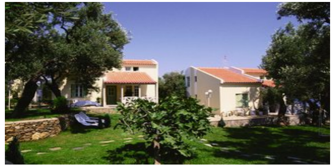
Die Anlage Sea Sun

MAISONETTES (MA) Ca. 50 qm. Für 2-4 Personen. Grundausrüstung wie die Studios. Im Erdgeschoss Wohnraum mit Sitzecke und Küche. Separates Schlafzimmer mit französischem Bett.