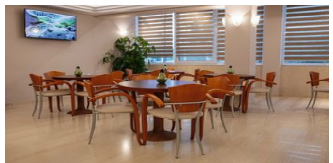
An der Lobby Bar