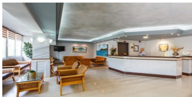
Die Lobby mit Rezeption