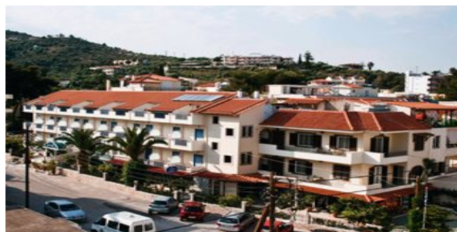
Blick auf das Serenity Hotel Tolo