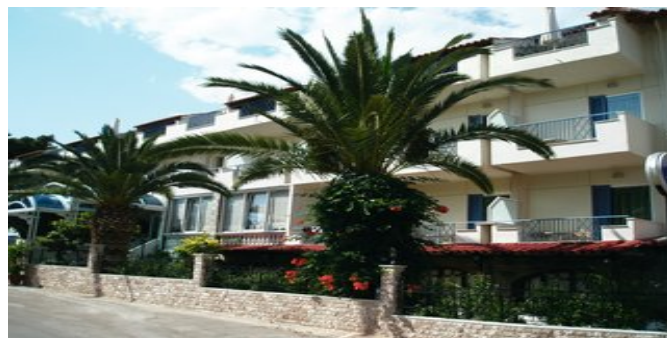
Das Serenity Hotel Tolo