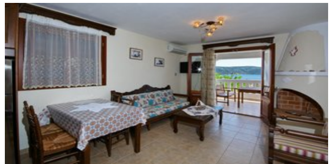
Wohnbeispiel - Villa 4 und 5