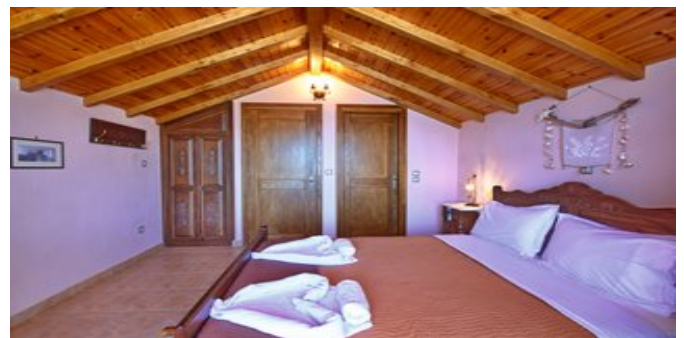
Wohnbeispiel - Villa 4 und 5