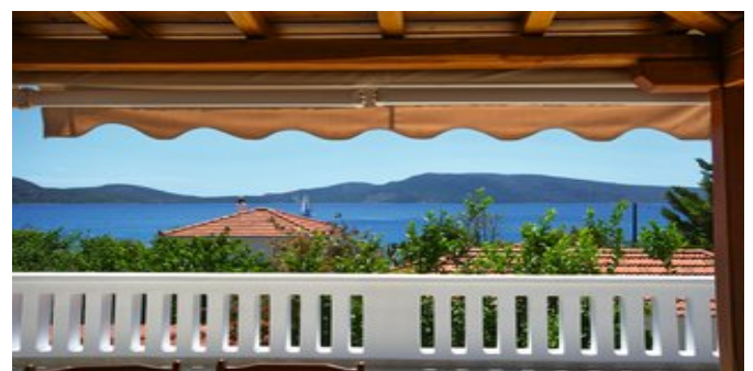
Wohnbeispiel - Blick von der Villa 3