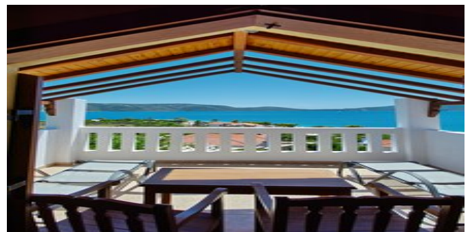
Wohnbeispiel - Villa 4 und 5