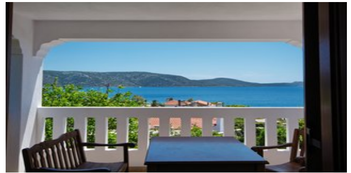
Wohnbeispiel - Villa 4 und 5

STRAND Herrlicher Kieselstrand mit einer Taverne und 2 Strandkiosken. Liegen und Sonnenschirme vor der Anlage für die Hausgäste ohne Gebühr.