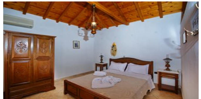
Wohnbeispiel - Villa 2 und 3