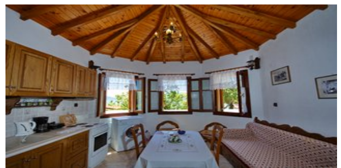
Wohnbeispiel - Villa 2 und 3