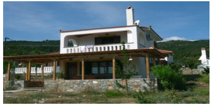
Eine der Pelagos Villas - Beispiel Villa 2 und 3