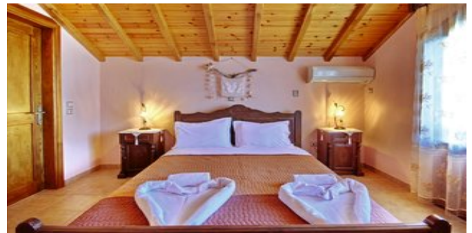
Wohnbeispiel - Villa 4 und 5