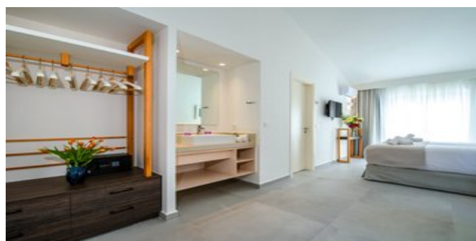
Wohnbeispiel Superior Studio