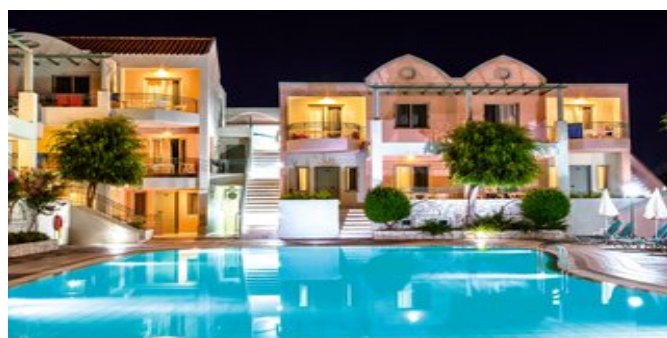
Die Anlage mit Pool