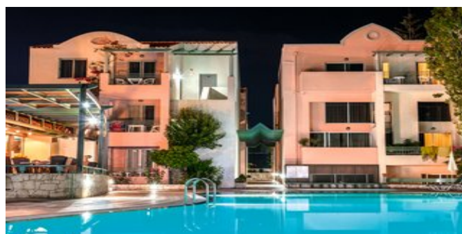
Abendstimmung am Pool