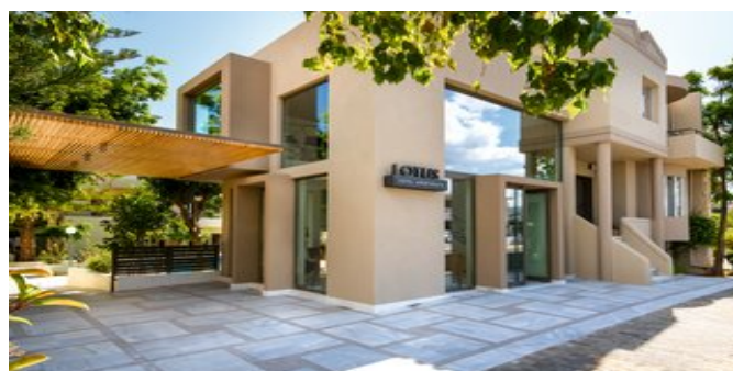
Die Lotus Hotel Apartments