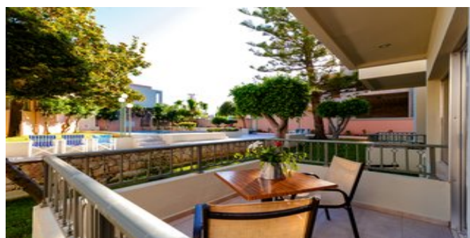
Blick vom Balkon auf die Anlage