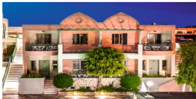
Die Lotus Hotel Apartments