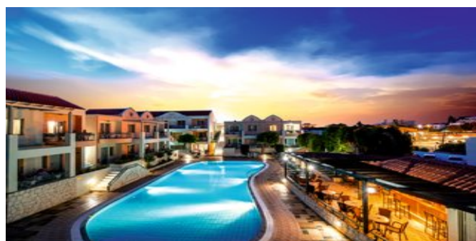
Abendstimmung am Pool