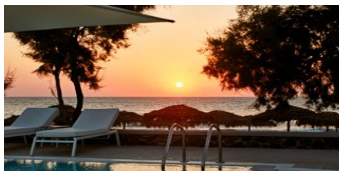
Blick über einen der Pools auf das Meer