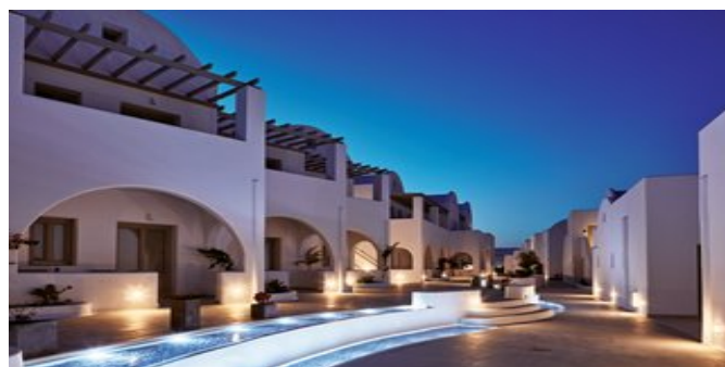
In der Anlage