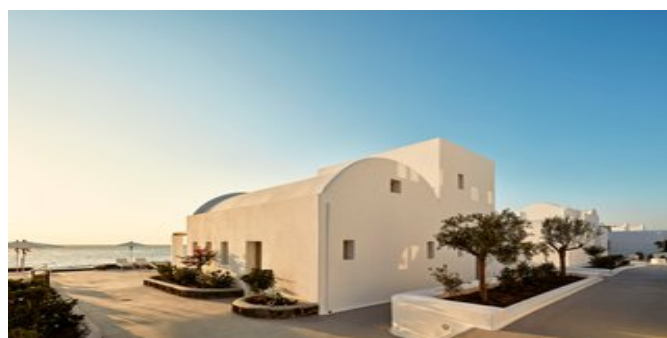
In der Anlage