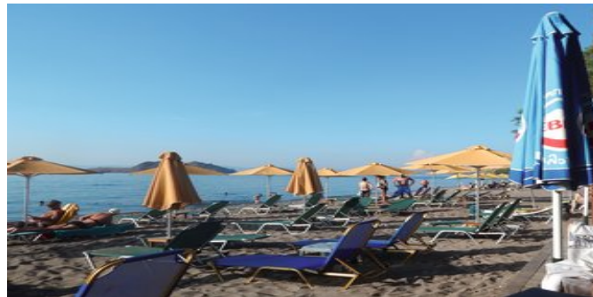
Der Strand in der Nähe der Anlage