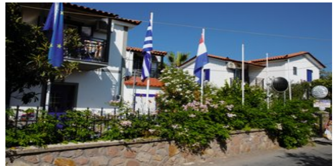
Das Anaxos Garden