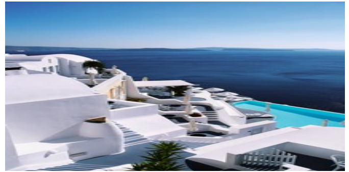
Die Anlage mit Pool