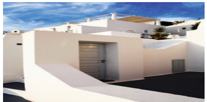
Das Hotel Katikies