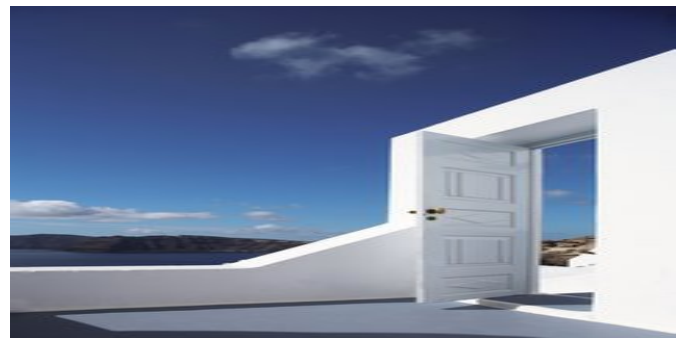
Das Hotel Katikies