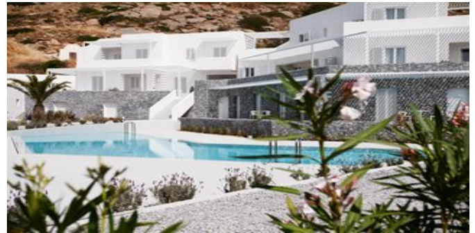
Das Hotel Relux Ios