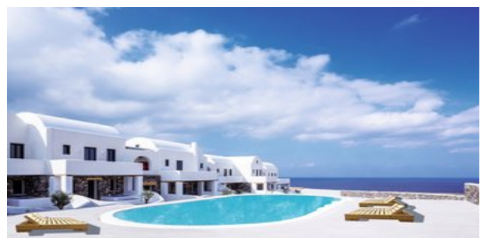
Blick auf die Anlage mit dem Pool