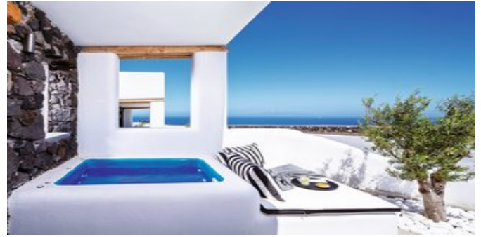
Wohnbeispiel Junior & Senior Jacuzzi Suiten

EXECUTIVE JACUZZI SUITEN (UD) Ca. 40 qm. Für 2-4 Personen. Grundausrüstung wie die Standard Zimmer, jedoch im Loft-Stil erbaut. Wohn-/Schlafbereich im Erdgeschoss mit Schlafsofa für die 3. und 4. Person. Über eine Treppe erreichen Sie den offenen Schlafbereich mit Doppelbett. Dusche/WC, Föhn, hochwertige Badeartikel, Bademantel, Slipper. Terrasse mit beheiztem Jacuzzi und Meerblick.