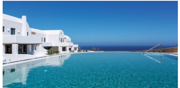
Blick auf die Anlage mit dem Pool