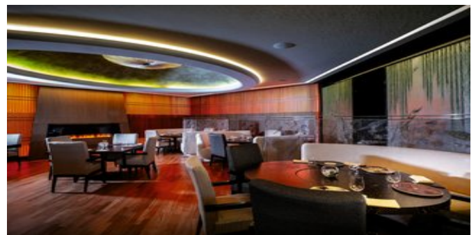
Im Oriental Restaurant