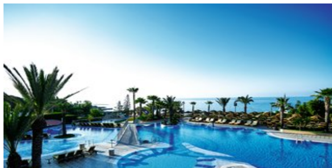
Blick auf den Hauptpool

PENTHOUSE SUITEN (UA) Ca. 55 qm. Für 1-2 Personen (nur für Gäste ab 18 Jahren). Alle 12 Suiten befinden sich in der 6. Etage des Hotels. Die zeitgenössisch-geschmackvolle Einrichtung vermittelt Eleganz und Gemütlichkeit. Kleiner Flur mit Garderobe. Wohnzimmer mit Sitzgruppe und Schlafcouch. Klimaanlage, Satelliten-TV (mit Pay-TV), Smart Room Technology, Schreibtisch,