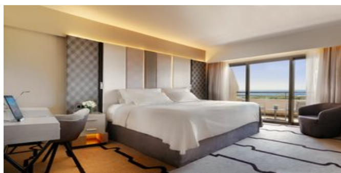
Wohnbeispiel Superior Zimmer