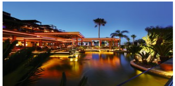
Das Café Tropical