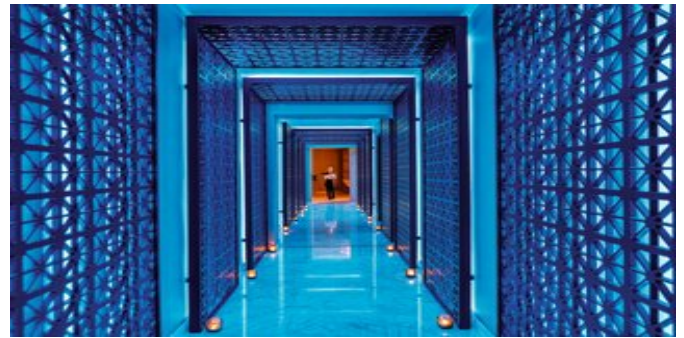
Im Shiseido Spa

EXTRAS Zur Begrüßung eine Flasche Mineralwasser und ein Obstkorb (saisonbedingt). Täglich 0,5 l Mineralwasser pro Person. Gäste der Penthouse Suiten können direkt auf Ihrem Zimmer einchecken und erhalten Obst und Sekt zur Begrüßung sowie auf Wunsch Hilfe beim Koffer auspacken. Jeden Abend zwischen 17.00 und 19.00 Uhr können die Gäste der Penthouse Suiten gratis Ihren Lieblingscocktail mit Kanapees serviert bekommen.