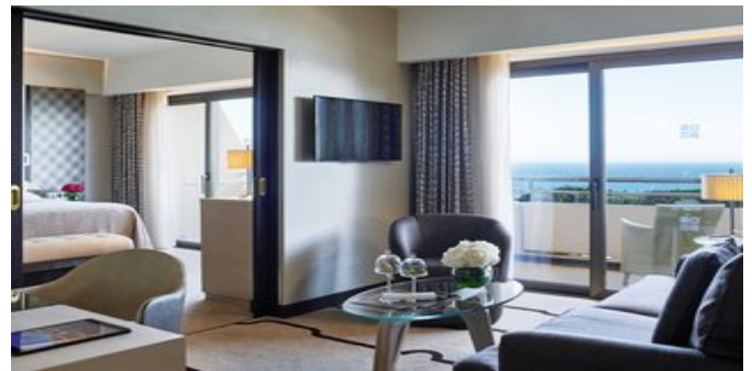
Wohnbeispiel Penthouse Suiten