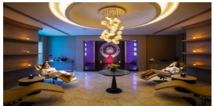
Im Shiseido Spa