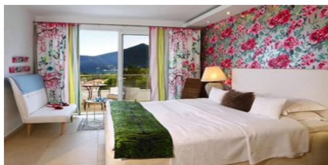
Wohnbeispiel Junior Suite