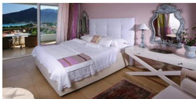
Wohnbeispiel Deluxe Suite