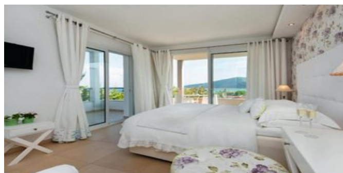
Wohnbeispiel Deluxe Suite