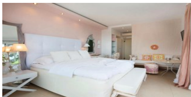
Wohnbeispiel Deluxe Suite