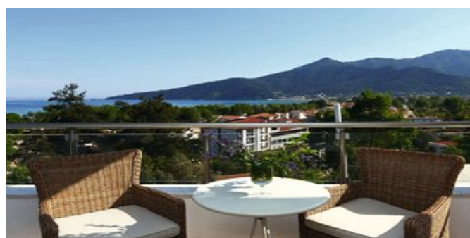
Blick vom Balkon einer Deluxe Suite