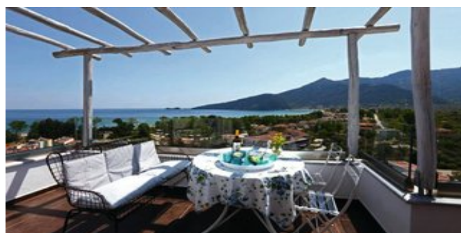
Blick vom Balkon einer Executive Suite