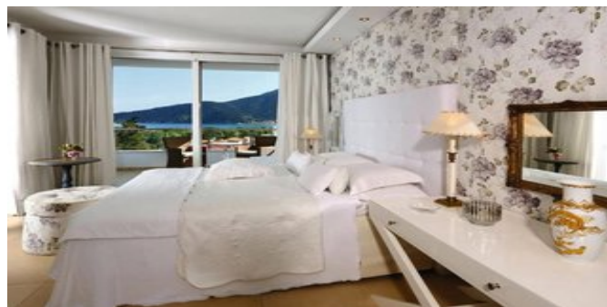
Wohnbeispiel Deluxe Suite