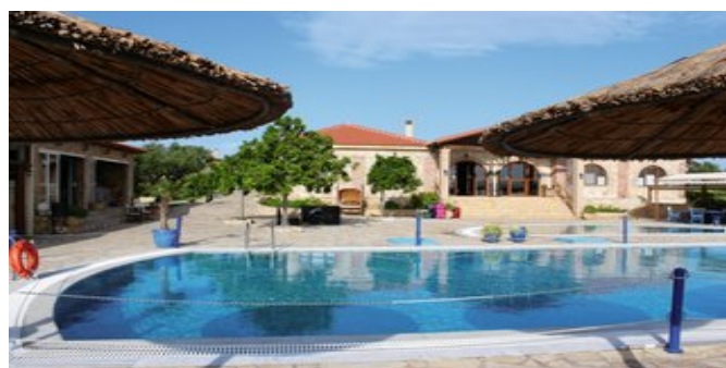
Ein Teil der Anlage