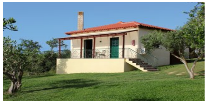
Eines der Ferienhäuser