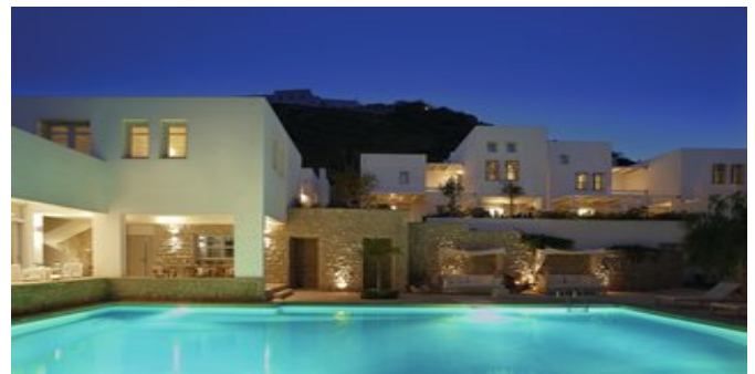
Abendstimmung im Ammos Hotel