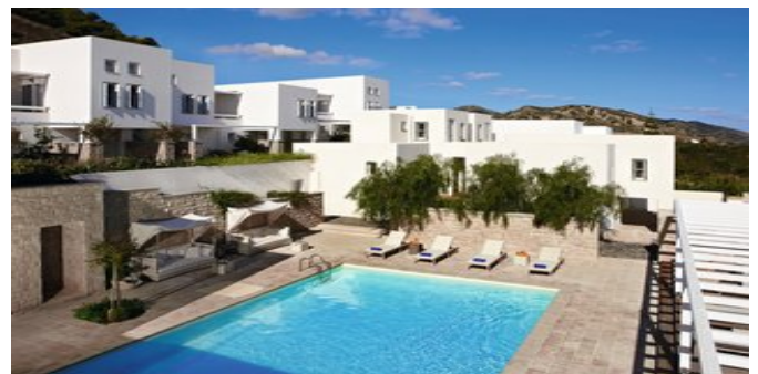
Blick auf den Poolbereich