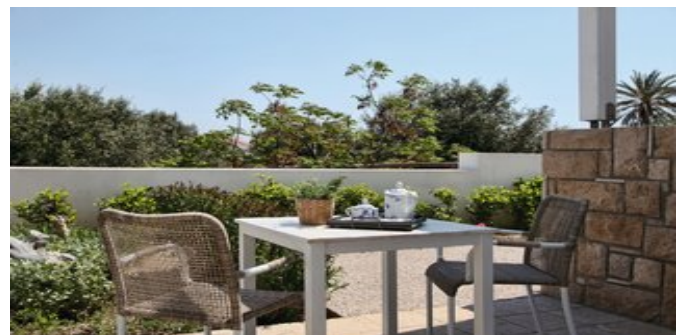
Blick von der Terrasse