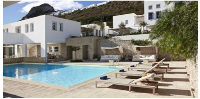
Das Ammos Hotel mit Pool

FRIENDS & FAMILY SUITEN (FA) Ca. 28-30 qm. Für 2-3 Erwachsene und 1 Kind. Grundausstattung wie die Zimmer. Auf der unteren Ebene Wohn-/Schlafbereich mit Doppelbett und Sitzbereich. Über eine Treppe erreichen Sie einen offenen Schlafbereich mit Betten für die 3. und 4. Person. Dusche/WC, Föhn, Apivita-Pflegeprodukte.