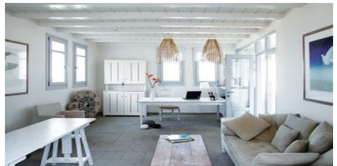
In der Lobby