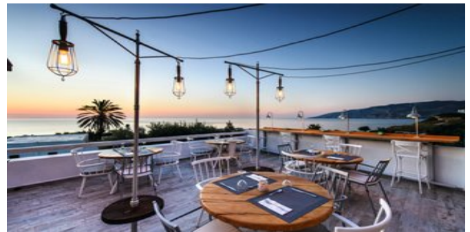
Auf der Terrasse des Restaurants