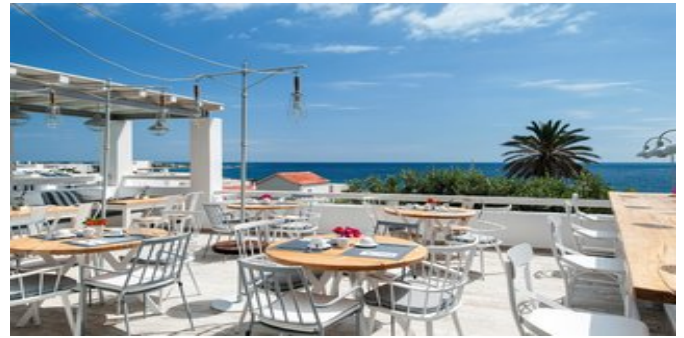
Die Terrasse des Restaurants