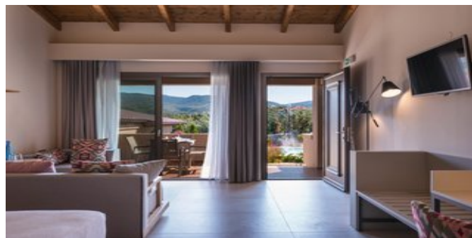
Wohnbeispiel Deluxe Junior Suiten

Website: www.attika.de E-Mail: verkauf@attika.de