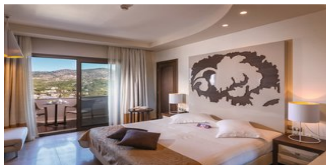
Wohnbeispiel Deluxe Zimmer mit Meerblick