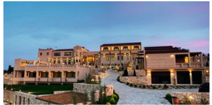
Die Anlage von Außen

EXECUTIVE SUITEN (UF/US) Ca. 48 qm. Lage im Hauptgebäude. Für 2-3 Erwachsene und 1-2 Kinder. Grundausrüstung wie die Zimmer. Geräumiger Wohn-/Schlafraum mit Sitzecke und Schlafcouch, ein separater Schlafraum. Bad/WC, Föhn, Bademantel, Slipper, Pflegeprodukte. Balkon mit Meerblick (= UF) oder mit limitiertem