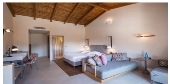
Wohnbeispiel Deluxe Juniorsuiten