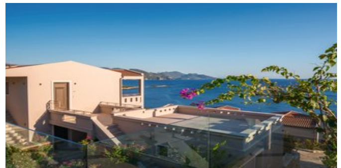
Blick von der Anlage