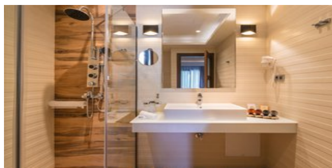
Wohnbeispiel Deluxe Junior Suiten Badezimmer