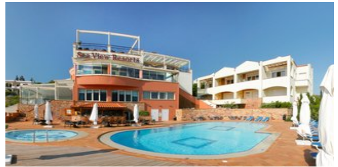
Das Sea View Resorts & Spa Hotel

AKTIVITÄTEN / SPORT Ohne Gebühr: Fitnessraum.