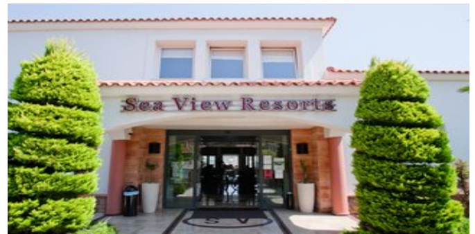
Das Sea View Resorts & Spa Hotel