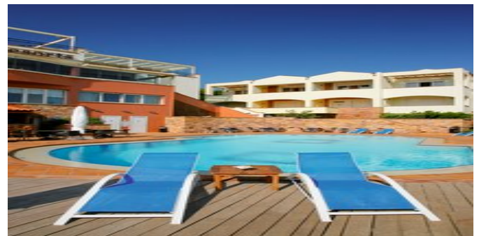
Die Anlage mit Pool