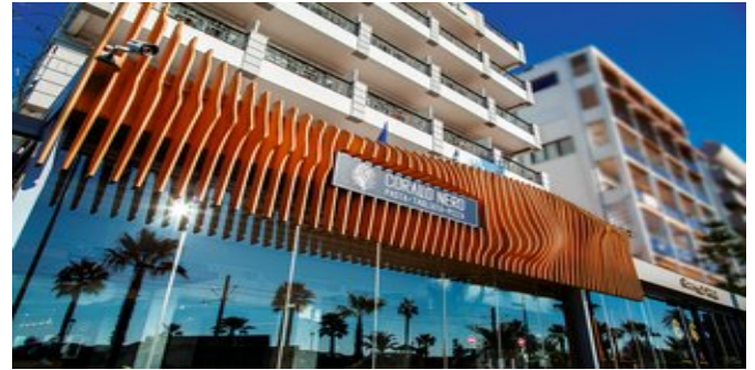
Das Coral Hotel

SPARTIPP Bei Buchung eines Attika Mietwagens ab/bis Flughafen Transfergutschrift EUR 60 pro Person. Einen Mietwagen der Kat. A1 erhalten Sie schon ab EUR 140 pro Woche.