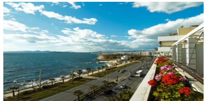
Blick vom Balkon / Hotel Coral