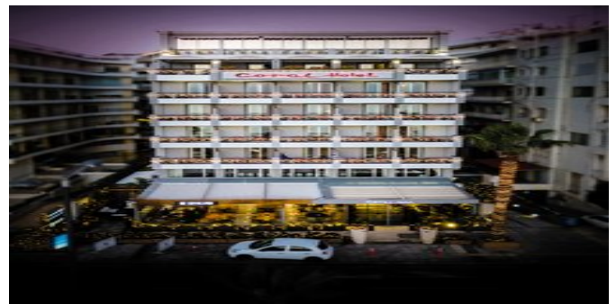
Das Coral Hotel