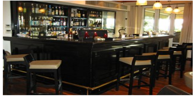
An der Bar