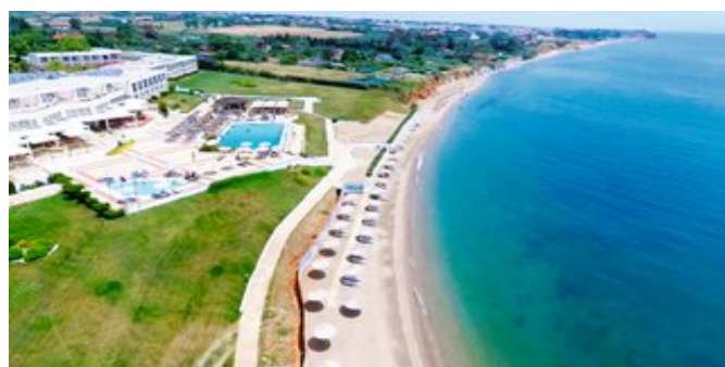
Blick auf das Ramada Plaza Thraki