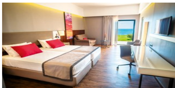
Wohnbeispiel Executive Zimmer