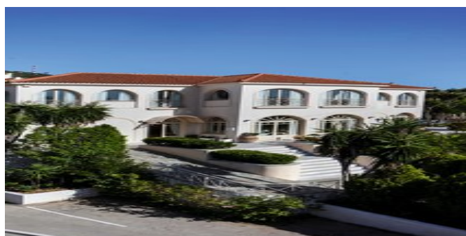
Das Princess Hotel