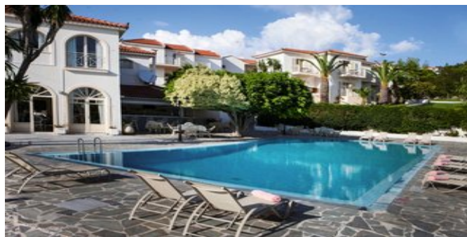
Die Anlage mit Pool

SPARTIPP Bei Buchung eines Attika Mietwagens Transfergutschrift ab/bis Flughafen EUR 42, ab/bis Hafen bis zu EUR 94 pro Person. Einen Mietwagen der Kat. A1 erhalten Sie schon ab EUR 140 pro