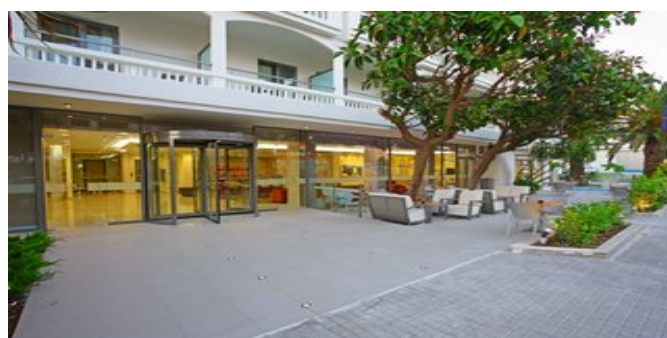
Das Hotel Olympic Palladium