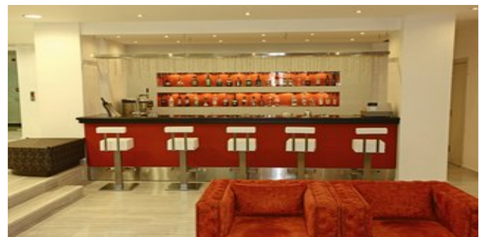
In der Bar