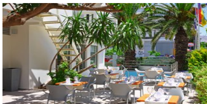
Auf der Terrasse