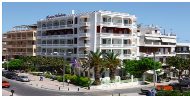
Das Hotel Olympic Palladium

ATTIKA SERVICE Taxitransfer bei Pauschalreise inklusive.