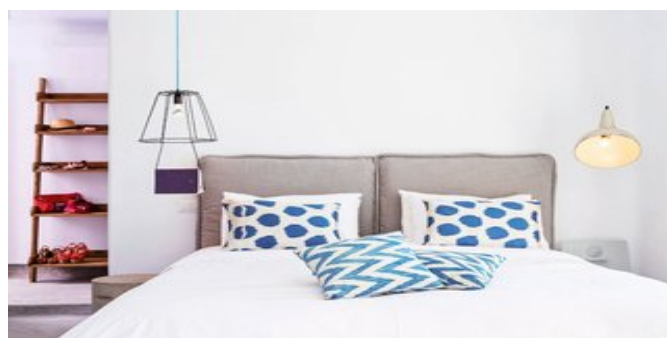
Wohnbeispiel Superior Suiten