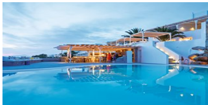
Das Boheme Hotel mit Pool

HONEYMOON SUITEN (UD) Ca. 35-38 qm. Für 2-3 Personen. Moderne Einrichtung mit natürlichen Elementen. Grundausstattung wie die Classic Suiten. Bad oder Dusche/WC, Föhn, Bademantel, Slipper, luxuriöse Pflegeprodukte. Große Terrasse mit Panorama-Meerblick, Jacuzzi, Essecke und Relaxbereich.