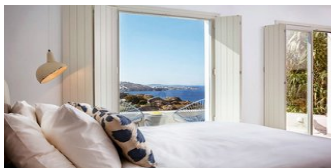
Wohnbeispiel Deluxe Suiten