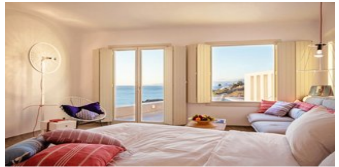
Wohnbeispiel Deluxe Suiten