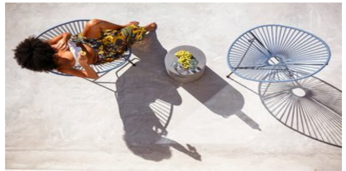
In einer der Honeymoon Suiten