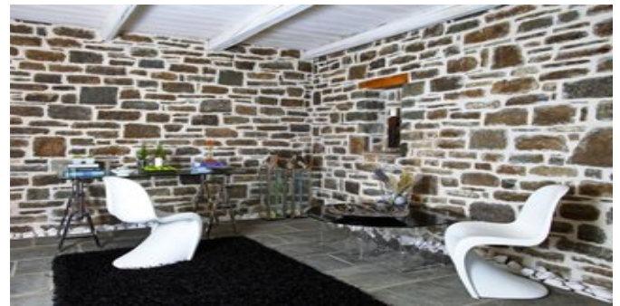
In der Lobby