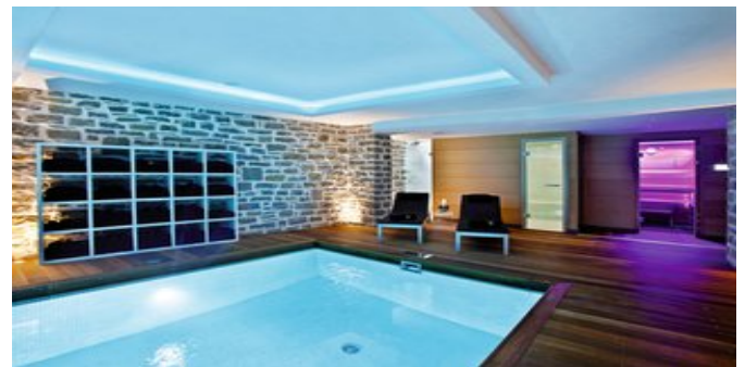
Im Spa Bereich