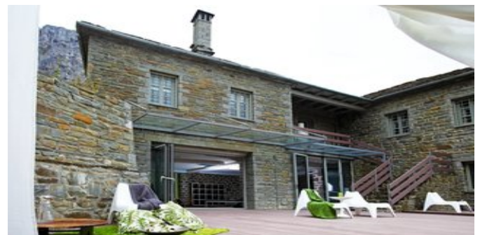
Der Spa Bereich