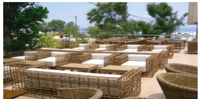
Der gemütliche Außenbereich der Bar