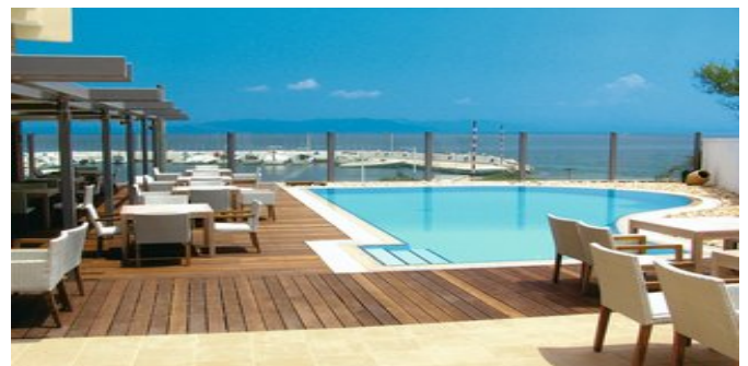
Der Poolbereich mit Blick auf die Marina