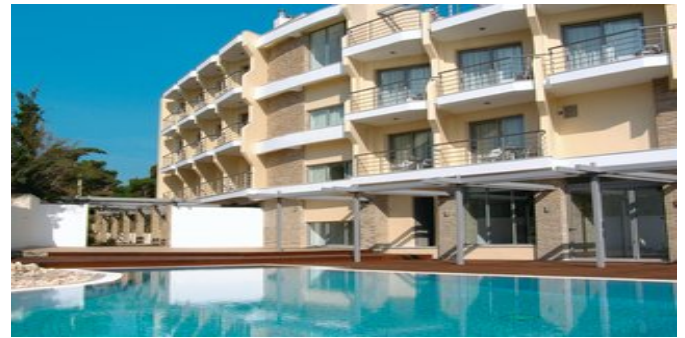
Das Hotel Cabo Verde