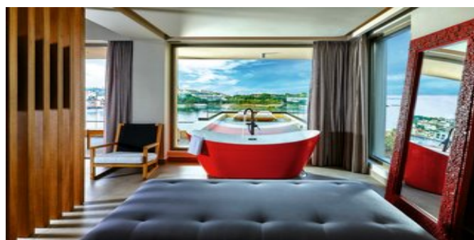
Wohnbeispiel Ruby Suite