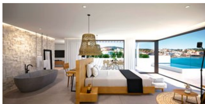
Wohnbeispiel Diamond Suite