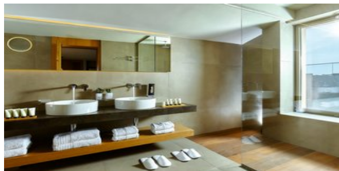
Wohnbeispiel Sapphire Suite

ATTIKA SERVICE Taxi-Transfer bei Pauschalreise inklusive.