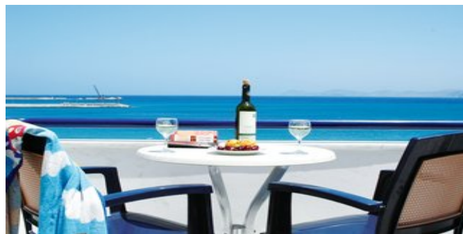
Wohnbeispiel mit Meerblick