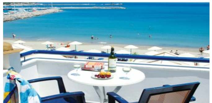
Wohnbeispiel mit Meerblick