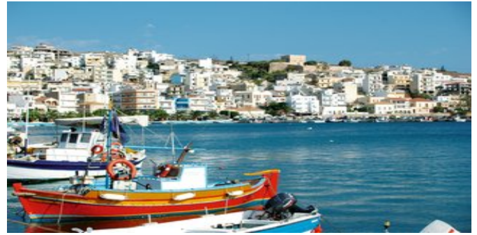
Der Hafen von Sitia