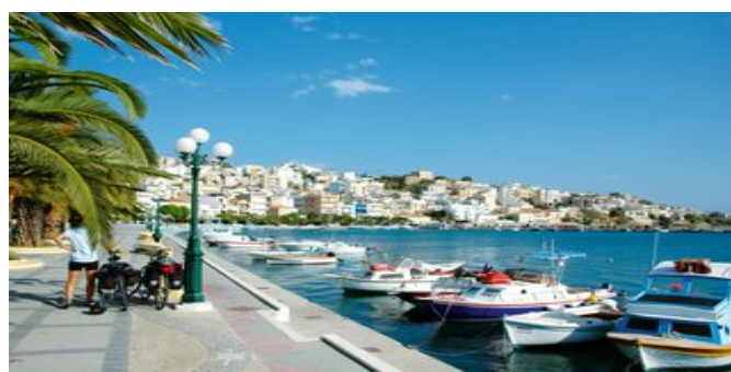
Der Hafen von Sitía