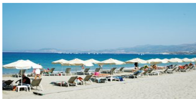
Der Strand von Sitía