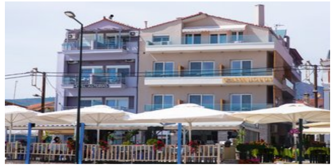
Das Hotel Molos