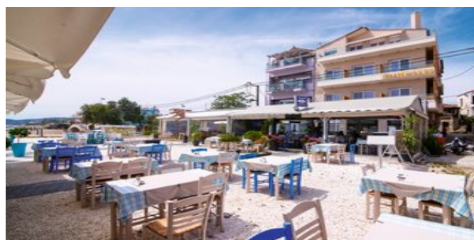
Das Molos Hotel