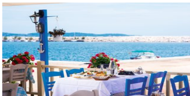
Herrlicher Ausblick vom Restaurant