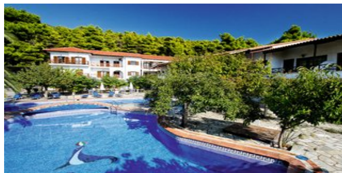
Die Apartments Delphi mit Pool

POOLBEREICH In der gepflegten Gartenanlage