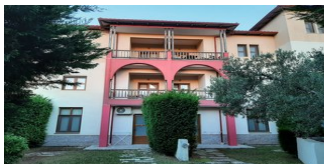
Die Hotel-Studios Gi-Ga-Mar