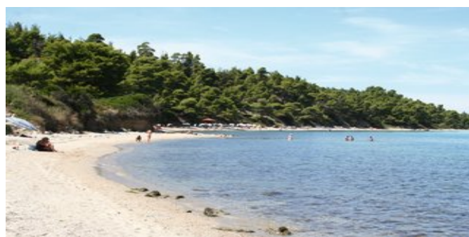
Der Strand von Kriopigí