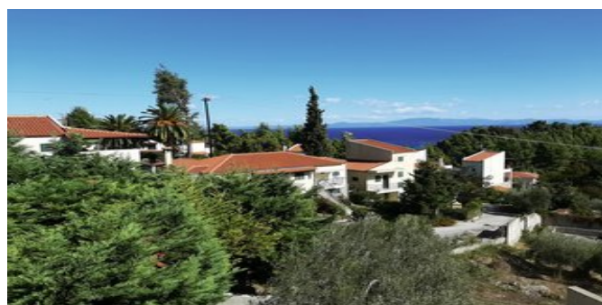
Blick von der Anlage