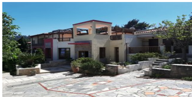
Die Hotel-Studios Gi-Ga-Mar