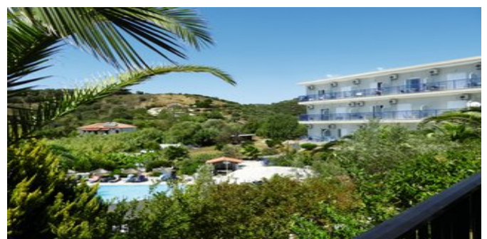
Das Hotel Golden Sun