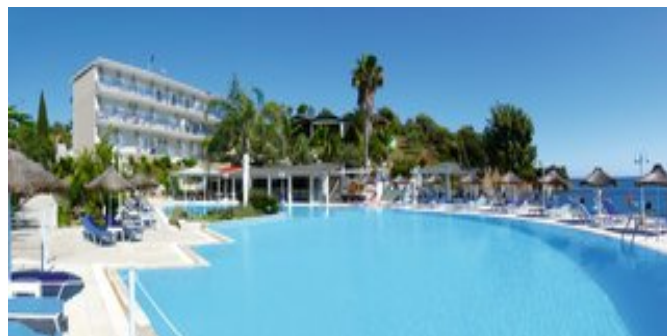
Blick auf den Pool und das Hotel

SPARTIPP Bei Buchung eines Attika Mietwagens Transfergutschrift ab/bis Kalamáta EUR 104, ab/bis Araxos EUR 352 pro Person. Einen Mietwagen der Kat. A1 erhalten Sie schon ab EUR 140 pro Woche.