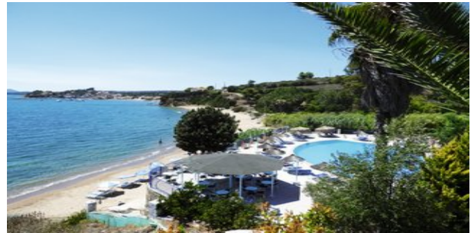
Blick auf den Pool und den Strand