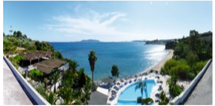
Blick über die Anlage zum Meer