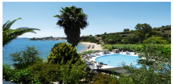
Blick auf den Poolbereich und das Meer