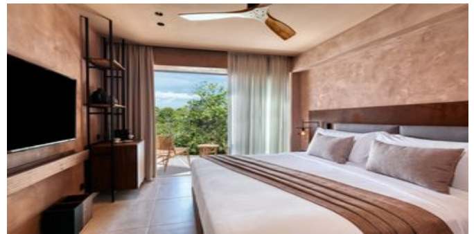
Wohnbeispiel Tropical Retreat Zimmer