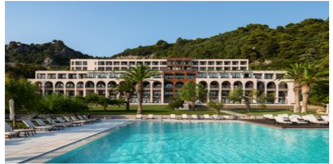
Das Domes of Corfu

SAPPHIRE RETREAT ZIMMER (RB) Ca. 22-24 qm. Grundausstattung wie die Inland Retreat Zimmer. Dusche/WC, Föhn, Pflegeprodukte, Bademantel, Slipper. Balkon mit Meerblick.