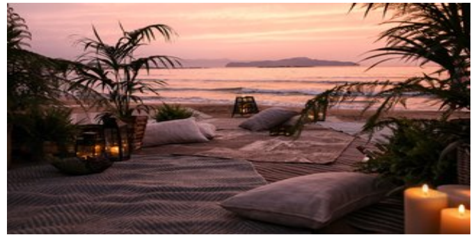
Abendstimmung am Strand

TROPICAL SUBLIME FAMILY SUITEN (UM) Ca. 46 qm. Für 2-3 Erwachsene und 1 Kind. Teil der "Haute Living Selection". Grundausrüstung wie die Inland Retreat Zimmer. Wohn-/Schlafbereich mit Schlafsofa und separates Schlafzimmer mit Doppelbett. 2x Dusche/WC, Föhn, Pflegeprodukte,