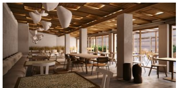
Das "Psarotaverna" Restaurant