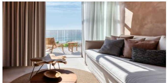
Wohnbeispiel Sapphire Family Retreat